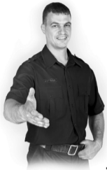
График работы сутки через двое. Оплата от 2200 р. за смену м. Автово, Ленинский пр. График работы суточный. Оплата 25000 р.

Курортный р-н (п. Солнечное), Приморский р-н, м. Петроградская, Кудрово, п. Колтуши, м. улица Дыбенко, м. Ломоносовская