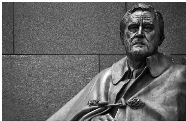
Монумент Франклину Рузвельту в США.

С 1864 года День Благодарения в США отмечался в последний четверг ноября — он мог быть 4-м или 5-м по счету. В 1939 году «День индейки» выпал на пятый четверг. Продолжалась Великая Депрессия, экономика еще не восстановилась полностью. А тут еще и сезон рождественских продаж сократился (вы ведь помните, что они стартуют сразу после праздника).