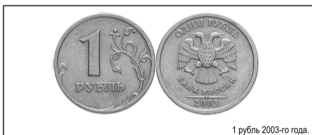
1 рубль 2003-го года.

Удивительно, но в далёком (уже) 2003-ом годовую монету в один рубль отчеканили только небольшим тиражом в Санкт-Петербургском монетном дворе. Конечно, монеты пошли в обиход, и 95% людей даже не подозревали об их редкости. Но если сейчас вы обнаружите 1 рубль 2003-го с пометкой СПМД, то радуйтесь: его можно продать 10 000 дороже.