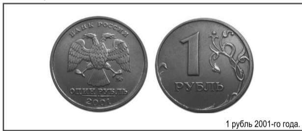
1 рубль 2001-го года.

Нет, 30 000 дают, конечно, не за каждую монету. А за тот рубль, который был выпущен ограниченным тиражом, точную численность которого не знают даже опытные нумизматы. Оpoznать «золотую» монету несложно: надпись «один рубль» над числом 2001 выполнена ровной строчкой, а не полукругом, как у остальных монет того же года и номинала.