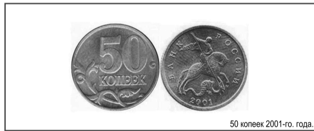
50 копеек 2001-го года.

Ещё один «привет» из 2001-го и ещё одна монета, которая официально не была пущена в оборот. Но на рынок-таки попала. Во всяком случае, в этом уверены нумизматы. Хотя 50 копеек – это настоящий единорог и почти городская легенда, ведь не было зарегистрировано ни одного факта продажи этой монеты в России. Но если это произойдёт, то вознаграждение в 100 – 120 000 рублей счастливицу обеспечено.