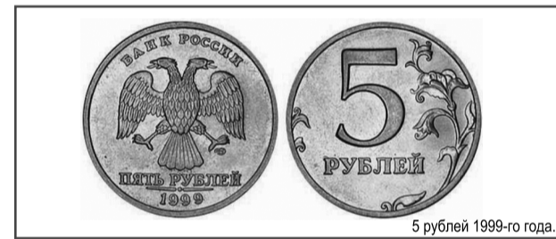
5 рублей 1999-го года.

Если вы всерьёз мечтаете почувствовать себя Индианой Джонсом и добыть сокровище, то ищите редкую «пятирублёвку» 1999-го. Официально зарегистрирован только один экземпляр этой монеты. И везучий обладатель просто обнаружил её в своей копилке. Но ведь должны быть и другие. А потому, держайте и обратите внимание на отличительные признаки, о которых напоминают коллекционеры: круглый верхний левый угол цифры «5», госта справа имеет острые углы, заостренные ступеньки в нижней части букв слова «РУБЛЕЙ», лист растения касается канта, точка малая, маленький овальный знак монетного двора. Вот уж точно, копейка рубль бережет!