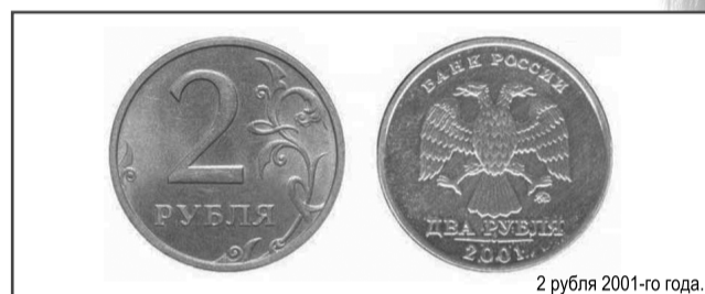
2 рубля 2001-го года.

2001-ый был вообще богатым на редкости годом. «Спасибо» экономической нестабильности и неразберихе в стране. К примеру, в тот год монеты номиналом в 2 рубля официально не были заказаны ни одному монетному двору. Но так уже вышло, что Московский монетный двор (ММД) отчеканил небольшое количество «двухрублёвок» и пустил их в обиход. И если вам попадается «двойка» образца 2001-го, радуйтесь: коллекционеры готовы заплатить за неё 35 000 рублей!