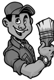
график работы по договоренности, оформление по ТК РФ, полный соц. пакет – отпуск, б/лист, возможна работа по совместительству.