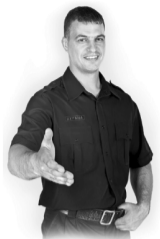
График работы сутки через двое.